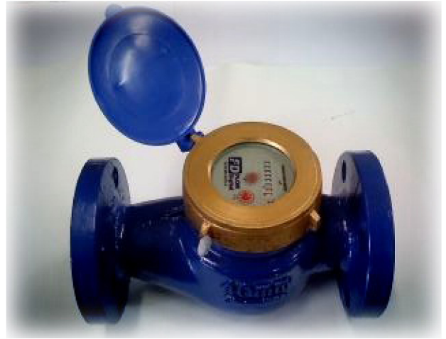
DYW - 40, 50