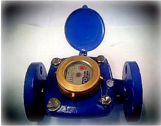
DYW - 25